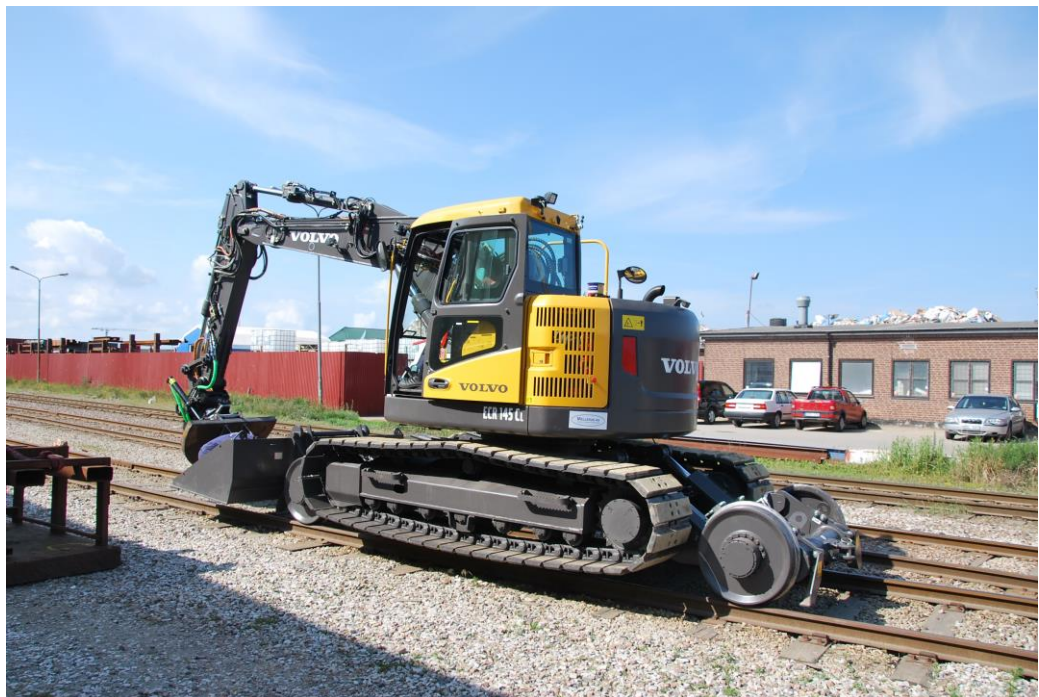
Ett av portföljbolaget Cede Group's specialtillverkade fordon